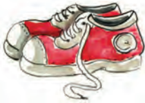
las zapatillas deportivas