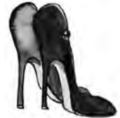
los zapatos de tacón